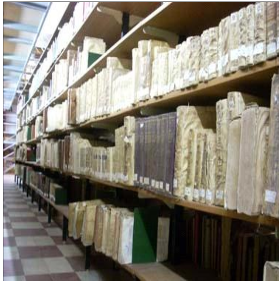
Biblioteca del Seminario Metropolitano de Badajoz / A.D

casi se duplica. Esto se debe a las donaciones del obispo D. Amador Merino y Malaguilla (1730-1756) y otro conjunto del obispo Solís y Gaguera.